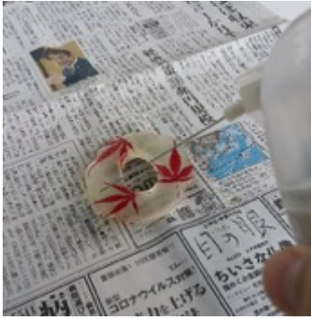
⑦ シリコンスプレーをかける。